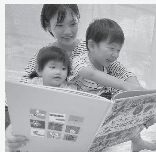
■3歳児への絵本プレゼント 民生児童委員協議会