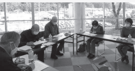
■赤名短歌会 ふじつる発刊