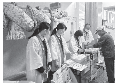
◆民生児童委員さんによるイベント募金のようす(10月・11月)