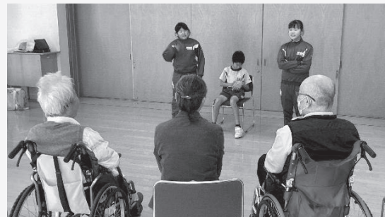
■頓原小学校 車椅子利用者の方との交流