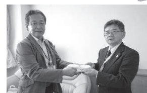
◆頓原公民館より募金をいただきました。