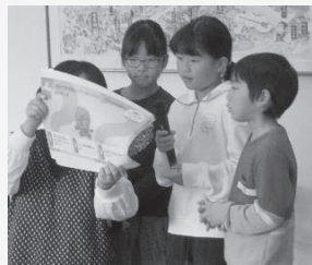
小学生による防災クイズ