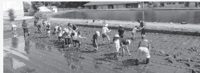
■志々小学校 交流体験