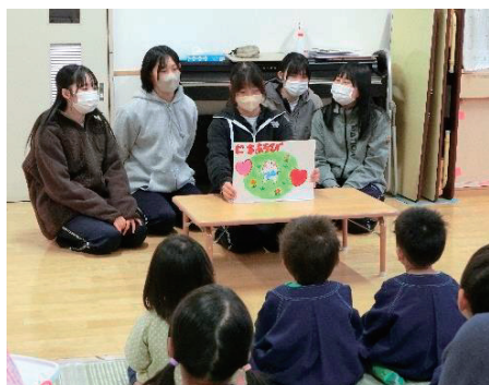
■飯南高校 JRC 部の生徒さんが赤い羽根共同募金 PR のため制作した紙芝居「ころんの一週間」。保育所に出かけ、読み聞かせをしていました。