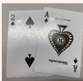
■点字トランプや点字 UNO (ウ) カード 四隅に点字が入っています。また食品のパッケージや生活用品にも点字が使われていることに気がつきました。