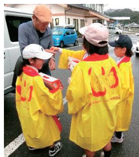
■小学生の協力で街頭募金活動やキャラバン隊活動を行いました